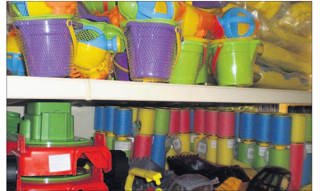
Lapsille löytyy laaja valikoima pihaleikkivälineitä. Tarjolla on myös oikeankokoiset työ hanskat, harjat, haravat ja lapiot pihatalkoisiin tai leikkeihin.