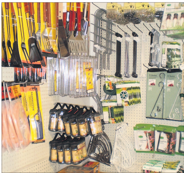
Työvälineitä Anjan Pihaputiikista löytyy grillausvälineistä lapioihin.